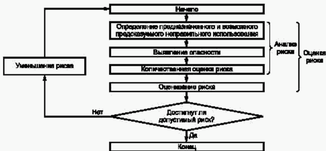
Рисунок 1 — Итеративный процесс оценки риска и уменьшения риска

5.3 Допустимый риск достигают с помощью итеративного процесса оценки риска и уменьшения риска (см. рисунок 1).